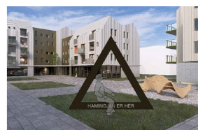
Hugmynd að myndatökuramma

Miðbær Porlákshöfn Miðbæjartorg - yfirlitsmynd Dags. 26.9.2024