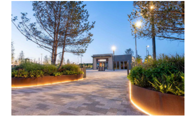
Setbekkir og gróðurbeði uppbyggð með Corten stáli