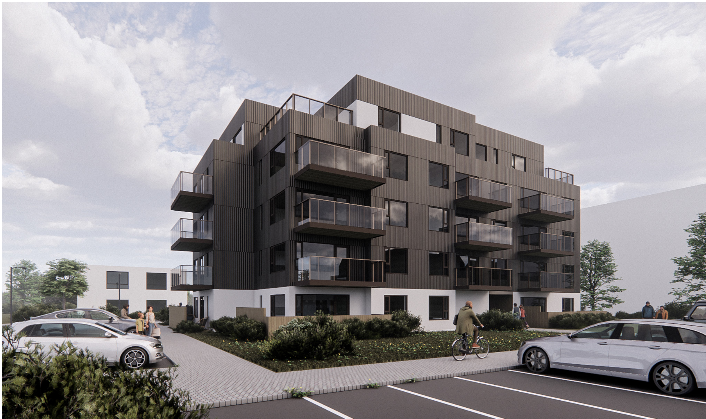
Fyrsta hús í hönnun Hnjúkamói 9 Aðaluppdrættir lagðir inn 20.09.2024